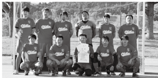
県民体育大会で優勝したソフトボール（上段）とホッケー（下段）の代表選手