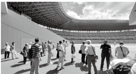
国立競技場の案内もしていただきました

参加者は、「障がいのある選手の介助方法を見ようと思ったが、選手はほとんど介助を受けることなく自分たちで競技に参加していて驚いた。」と話し、普段見ることのできない障がい者のスポーツ大会に熱い視線を注いでいました。