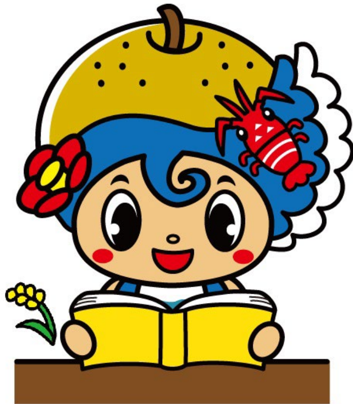
いすみ市マスコットキャラクター「いすみん」