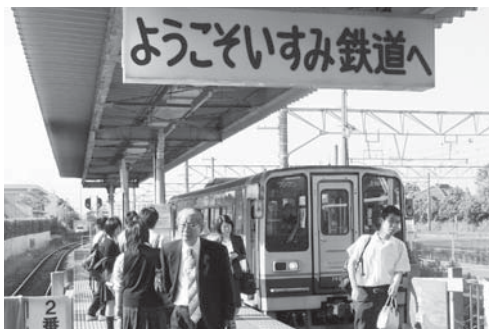
▲いすみ鉄道を利用しましょう

【高梨議員は、この質問のほか、「いすみ市第1次総合計画」について質問しました。】