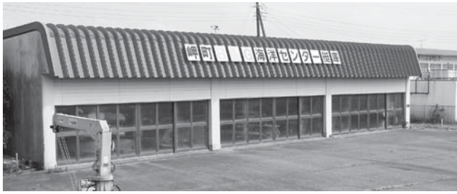
▲B & G海洋センター艇庫 「夏休み海洋スポーツ教室」などが毎年開催されます。