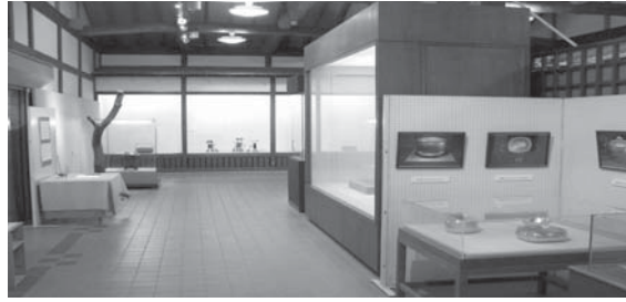
▲いすみ市郷土資料館展示室 1年を通して各種の企画展が開催されています。

（いすみ市郷土資料館、いすみ市水彩ギャラリー及びいすみ市B&G海洋センターの3施設を指定管理者により管理させることができるよう各施設の設置及び管理に関する条例の整備をしたものです。）