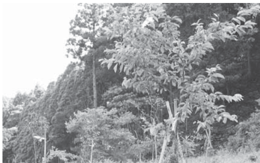
▲里山整備 桜の植樹 -岩船地区-

ります。このような自主 活動を側面から支援するこ とで、里山保全の普及に努 めたいと考えています。