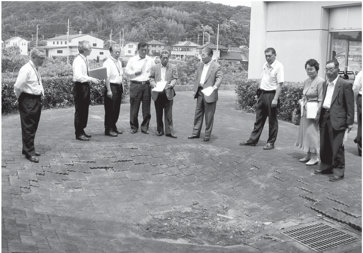
文教常任委員による社会教育施設の現地視察（大原文化センター）

ホームページアドレス http://www.city.isumi.lg.jp/ メールアドレス gikai-gizi@city.isumi.lg.jp