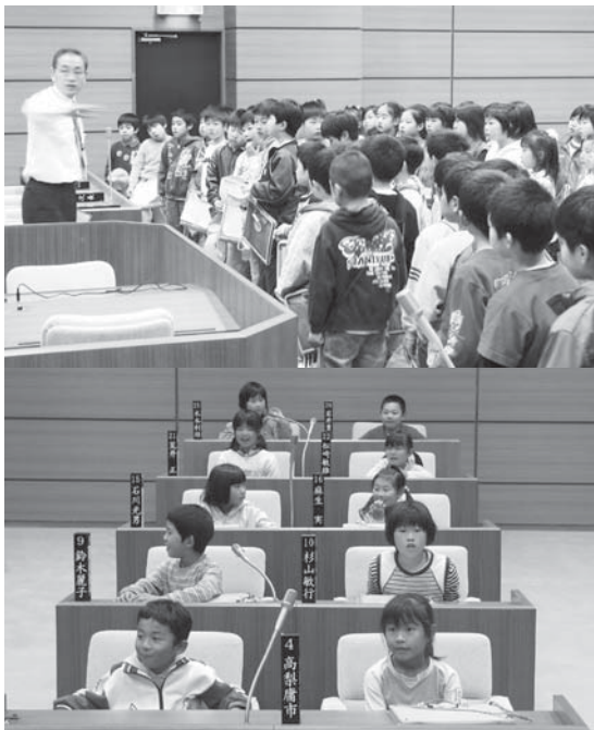
▲社会科見学で議場の説明を受ける小学生

単価見直しについては、近隣市町村、また指導的立場にある県と協議をしながら、事業が円滑に行えるよう検討していきます。