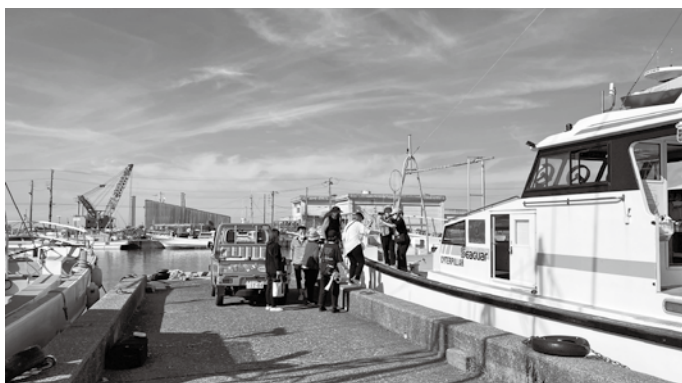
日本テレビドラマスチール撮影風景▶

iSFCでは、感染症予防対策を行った上で撮影を支援しています。引き続きロケ地およびエキストラの登録を募集しています。iSFCホームページからご登録いただけます。