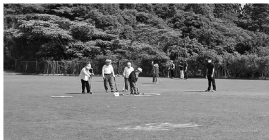
▲高齢者グラウンド・ゴルフ大会の様子