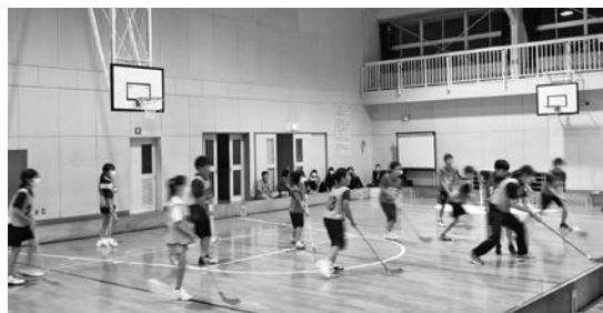
▲ユニホッケー教室・大会の様子