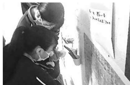
▲ちょボラ&ありがとう作戦

日常の教育活動の中で、生徒自身が「自分は誰かの役に立っている」、「誰かに喜んでもらえた」と感じられるような場面をつくることを大切にしています。例えば、運動会期間中、誰かに対し「ありがとう」と思った時、その内容を付せんを書いて貼っていく『ちょボラ（ちょっとしたボランティア）&ありがとう合戦』、仲間の頑張りや優しさをクラスの中で伝え褒め合う『ほめほめシャワー』など、周りの人の優しさに自分が支えられていること、そして自分自身も集団の中で大切な存在となっていることに気づける場面づくりに取り組んでいます。