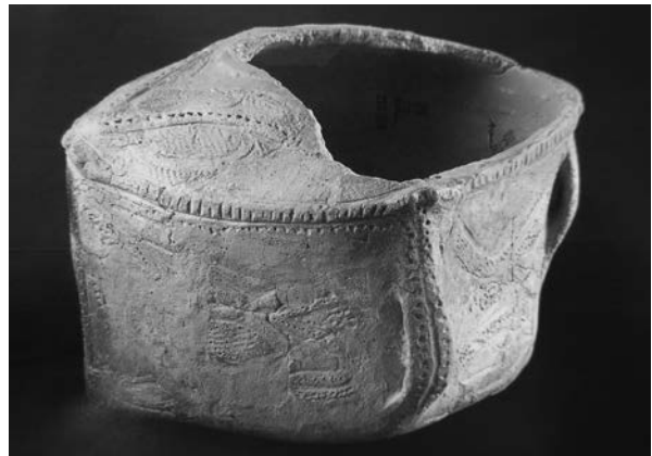
▲流山市三輪野山貝塚出土箱型壺

睦沢町歴史民俗資料館において、いすみ市、睦沢町、一宮町の3市町共催による特別展「上総広常の時代と伝承」(1月8日まで)を開催しています。