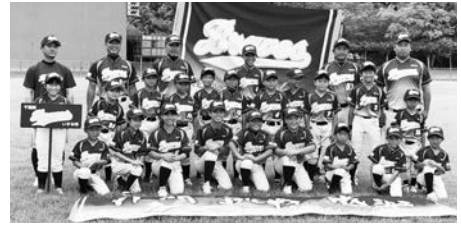
▲いすみブレイブスの皆さん