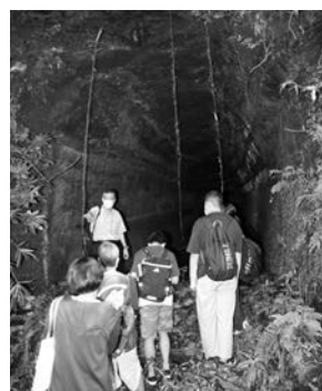
▲ 戦跡等の見学の様子

今後、生徒たちは、学んだことや感じたことについて各学校での報告会等を通じて伝え、広めていきます。