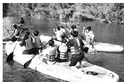
▲夷隅川自然体験（SUPクルーズ）

地域の一員として地域に爽やかな風を吹かせることを目指した経験が種となり、将来、よりよい社会を創る人材として芽吹いて欲しいと願っています。