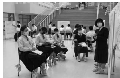
▲国語のグループ討議

また、「命」「性」「情報モラル」など、現代の様々な人権上の課題について学び考える機会を専門家等と連携しながら設定し、人権尊重を基盤とした学校づくりに努めています。