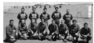
▲第7分団第2部(深堀)の皆さん

夷隅支部代表として、第7分団第2部(深堀)が小型ポンプ操法で出場し、努力賞を受賞しました。