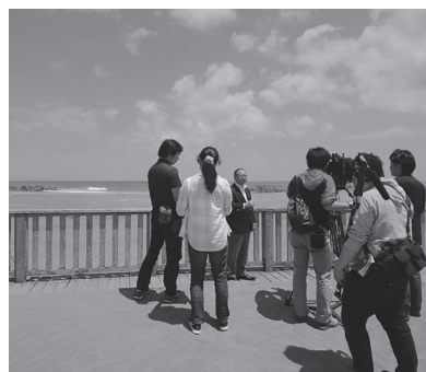
「ワールドビジネスサテライト」 撮影風景

ホームページ： http://www.isfc.jp f: www.facebook.com/iSFC.jp