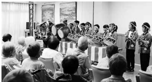
入所者の前でお囃子を披露する児童たち

長者小お祭りクラブの児童10名が、7月28日に特別養護老人ホーム愛恵苑（岬町中滝）を訪れ、入所者の前で長者囃子「通り囃子」を披露しました。長者囃子は、江戸時代中期以降に成立されたと推察され、クラブはこのお囃子を学習する目的で平成22年度に作られました。クラブは現在10名が参加し、長者小運動会をはじめ、「長者・中根