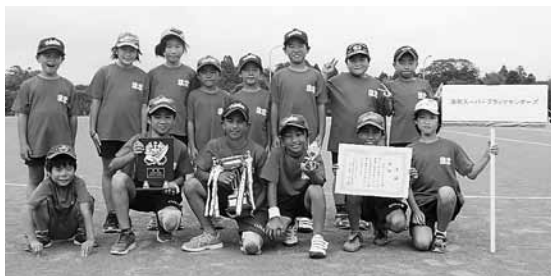
浪花スーパーブラックサンダーズ

また、8月6日に開催された第51回青少年のつどい夷隅地区（夷隅郡市）大会に夷隅郡市中から12チームが参加、市内からは上記4チームが出場しました。