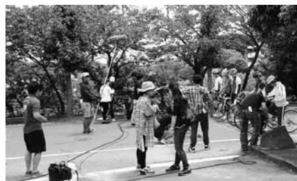
弱虫ペダル撮影の様子