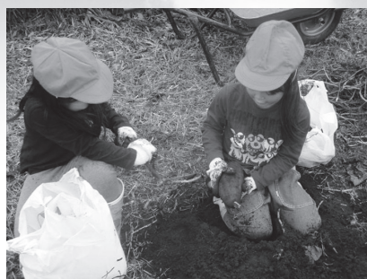
サツマイモ掘り(1・2年)

このように本校は、地域との関わりがとても深く、たくさんの人々に支えられています。今後とも地域とともに歩む学校づくりをすすめ、郷土を愛し、豊かな心と確かな学力を身につけた、たくましい長者っ子の育成に努めていきます。