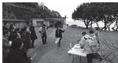
昨年度実施した関係者向け ロケ地ツアーの様子