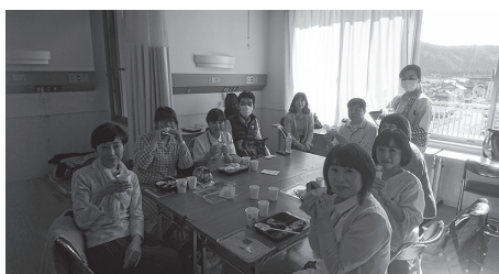
「最高の人生のを見つけ方」撮影風景 (エキストラの皆様)