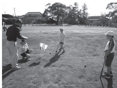
グラウンドゴルフ(4年)