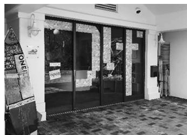
hinode内のフリースペースはどなたでも無料で休憩や談話、読書等にご利用いただけます。