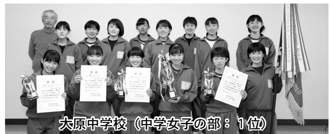
大原中学校（中学女子の部：1位）