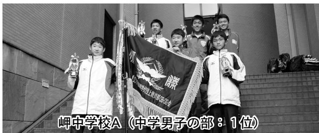
岬中学校A（中学男子の部：1位）