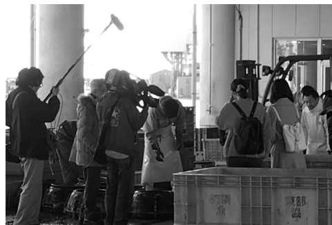
「ちば旅コンシェルジュ」撮影風景

問合せ先 大原庁舎 (3階) オリピック・観光課 シティプロモーション班 ☎62-1243 ホームページ： http://www.isfc.jp f ： www.facebook.com/iSFC.jp