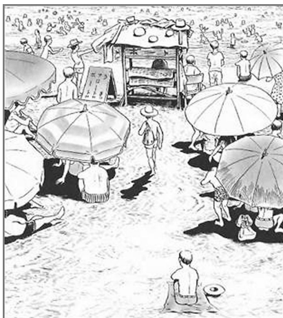
大原が舞台の「海辺の叙景」より 1967年 ガロ つげ義春

幼少期の数年を母親の故郷・大原で過ごした漫画家・つげ義春を紹介する展覧会「つげ義春と大原」展を、昨年11月6日～26日、大原海水浴場前のコワーキングコミュニティ「hinode」にて開催しました。