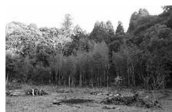
整備作業を終えた市内の竹林