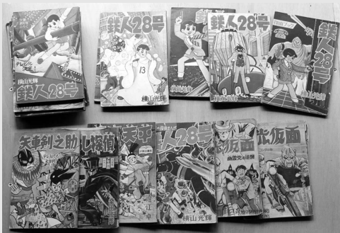
昭和30年代の漫画本