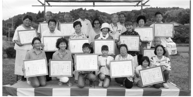
入賞を喜ぶ受賞者と関係者

作品の中には世相を反映したものや人気キャラクターを模したかかしなどがあり、多くの来場者を楽しませていました。