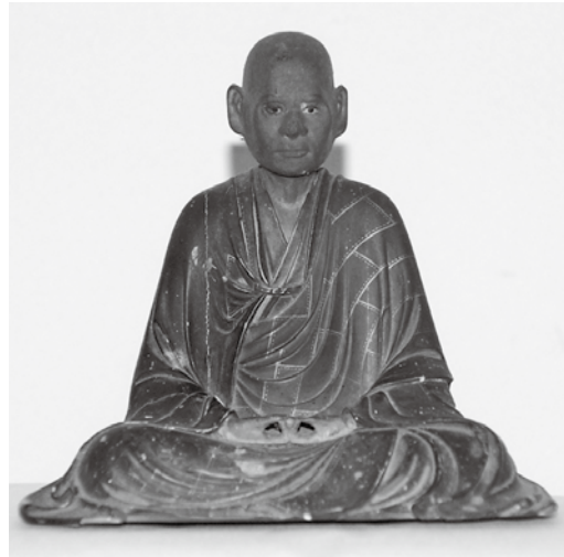
※現在郷土資料館で展示中です。

境内には徳本の字を模した「南無阿弥陀仏」の銘が刻まれた石塔(市指定文化財 第97回で掲載)が徳本念仏講中によって建てられています。