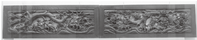
欄間彫刻「波に松竹梅」