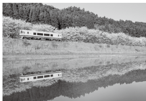
いすみ鉄道「上総東駅～新田野駅間」

沿線周辺の住民の皆さまにはコンテストの開催に伴い、カメラマンのお客様の来訪が見込まれますがご理解の程よろしくお願いたします。