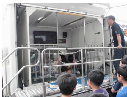
【地震体験車の様子】