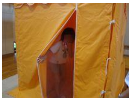
【煙体験ハウスの様子】