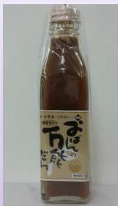
おばんの万能だれ