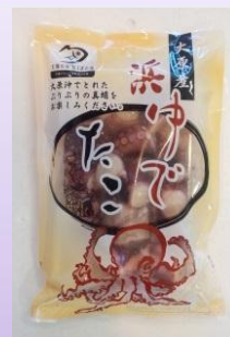
浜ゆでだこ(カット)