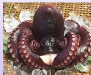
いすみの茹でだこ