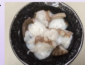
いすみの地だこスライス(生)