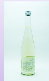
純米アス生(日本酒)