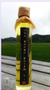
純正 東限のごま油