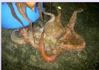
いすみの沖だこ(太東・大原産)