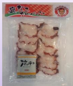
たこのカルパッチョ