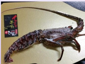
器械根イセエビ(干物)