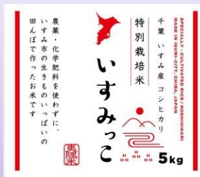
いすみっこ(特別栽培米)