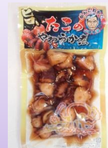
たこのやわらか煮