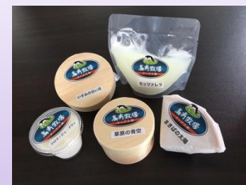
高秀牧場の手作りチーズ